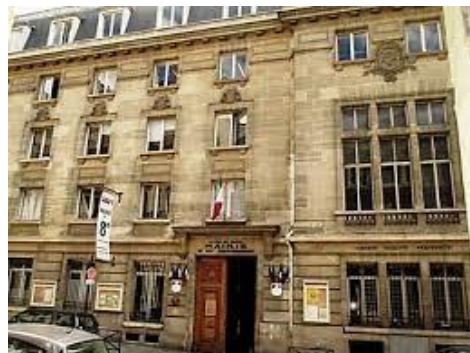
Mairie du 8ème