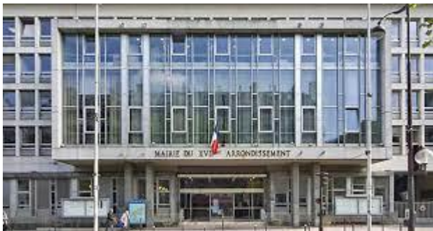
Mairie du 17ème