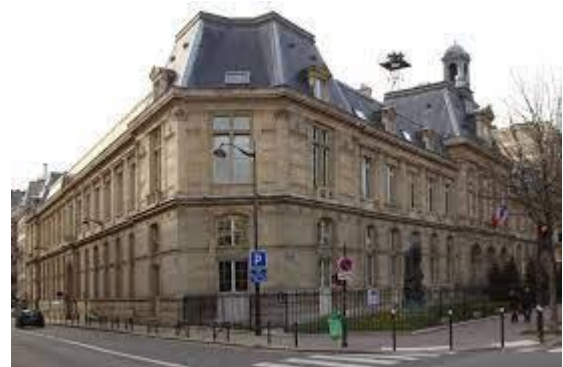
Mairie du 16ème