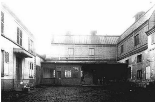
Premier bâtiment de l'école