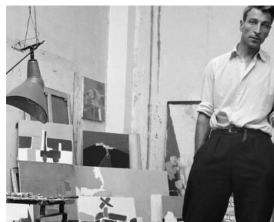
Nicolas de Staël dans son atelier (1954)

Rendez-vous jeudi 18 janvier 2024 à 17h30, à l'accueil du Musée d'Art Moderne de Paris – 11, av. du Pdt Wilson – Paris 16 e - Accès par le M° Alma-Marceau ou Iéna.