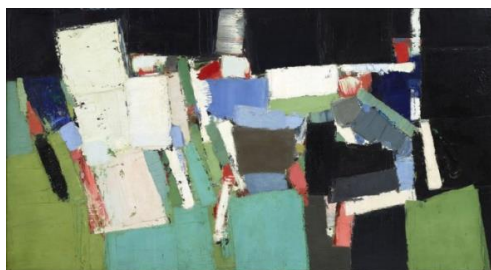
Le Parc des Princes (1952)

À côté de chefs-d'œuvre emblématiques tels que le Parc des Princes , elle présente un ensemble important d'œuvres rarement, sinon jamais, exposées, dont une cinquantaine montrée pour la première fois dans un musée français