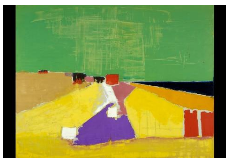
Sicile – Vue d'Agrigente (1954)

À côté de chefs-d'œuvre emblématiques tels que le Parc des Princes , elle présente un ensemble important d'œuvres rarement, sinon jamais, exposées, dont une cinquantaine montrée pour la première fois dans un musée français